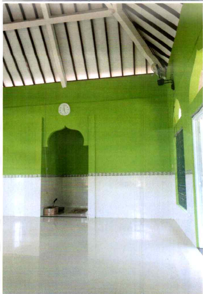
Gambar / Foto lantai Mushola Al Barokah Setelah dipasang granit