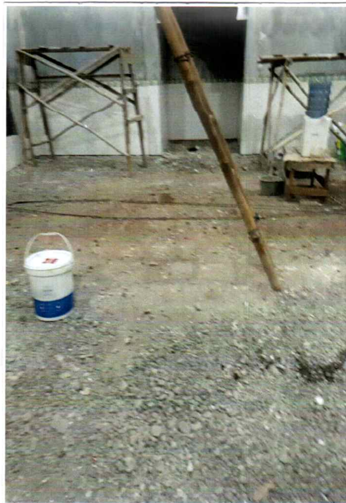
Gambar / Foto lantai Mushola Al Barokah Sebelum dipasang granit